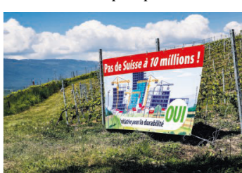
Votazione spartiacque il 14 giugno