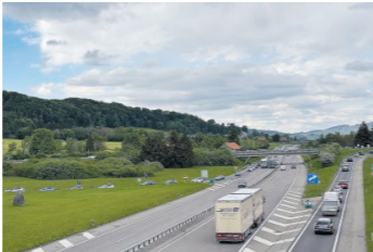
Ore 17.30: svincolo autostradale congestionato