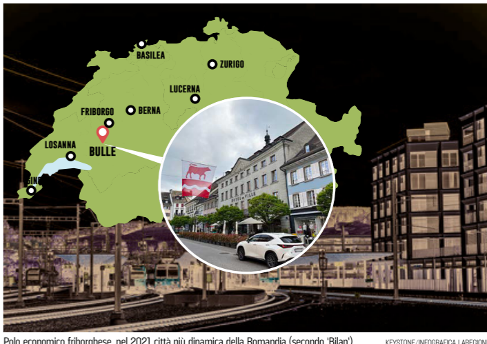
Polo economico friborghese, nel 2021 città più dinamica della Romandia (secondo 'Bilan')

Un certo malessere però serpeggia, per questa crescita che non pochi qui ritengono eccessiva e troppo rapida. Sarà l'Udc a capitalizzarlo? Scoppiierà il 14 giugno la rassicurante bolla collettiva in cui Bulle (incoronata nel 2021 da 'Bilan' città più dinamica della Svizzera francese) si pasce del suo benessere? A quanto pare, non molto tempo fa, sui 'social' circolava una fotografia (o un fotomontaggio) che mostrava la città in pieno fermento edilizio, col Moléson sullo sfondo. La immaginiamo sovrapposta a uno dei manifesti dell'Udc. E per un attimo abbiamo l'impressione che combacino.