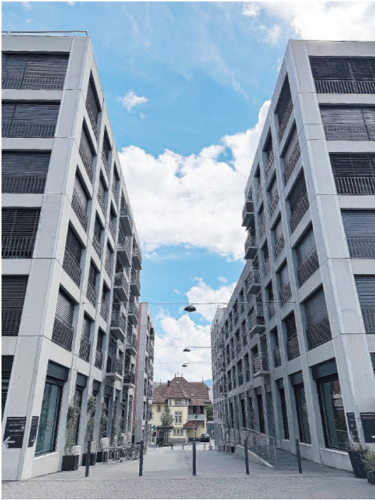
Il quartiere della stazione, il Moléson e la Place du Marché